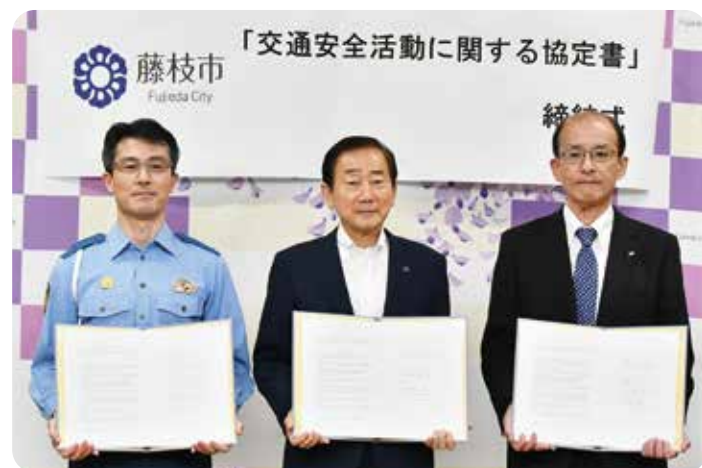
藤枝警察署、藤枝市、東海ガス株式会社